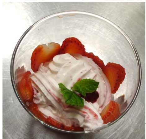
Aardbeien met munt En frambozenslagroom.