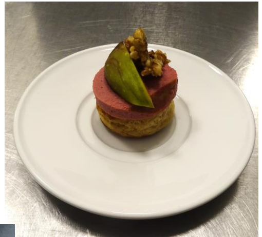
Blini's met vijgen en Paté