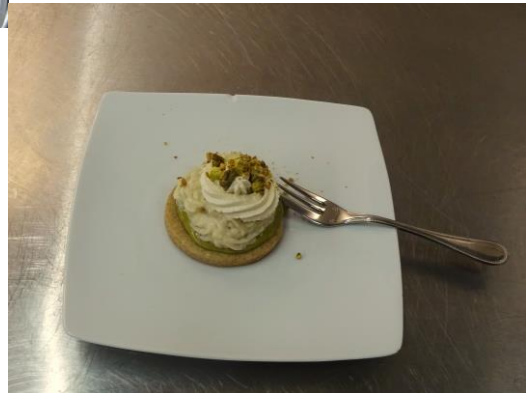
Zandtaartje met rijstpap Pistache en Kardemon