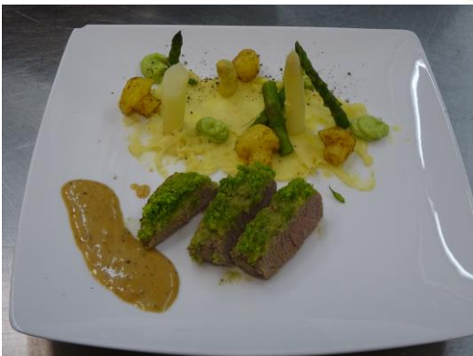
Lamsfilet met asperge's En doperwtjes crème