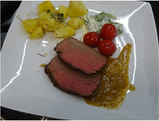
Runderfilet met rode peper met mierikswortelroom