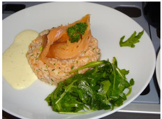
Steak Tartaar van Zalm met miewikswortel