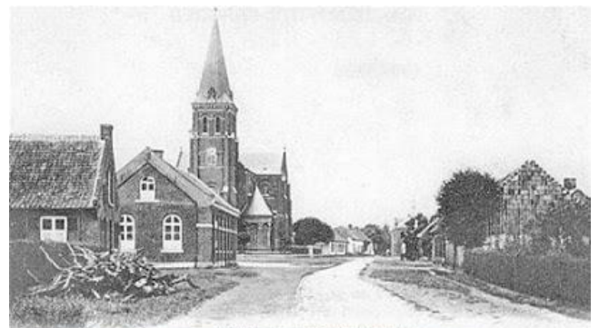
(Heusden) en complete Limbourgeoisie

Toch zijn we het aan ons zelf verplicht om langzaam de draad weer op te nemen en het vuur in onze vereniging weer aan te wakkeren. Heusden oogt de laatste tijd wel héél verlaten.